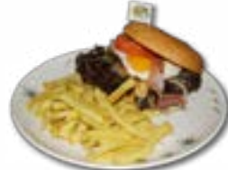
Swiss Poulet Burger