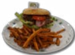
Black Angus Burger

Swiss Poulet Burger (150g Pouletbrust) Tartar-Sauce, Salat, Zwiebeln, Tomaten, Speck mit Süsskartoffel Pommes und 3 dl Getränk