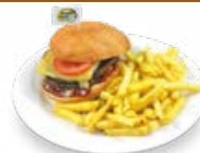
Ruedis Doppel Cheeseburger